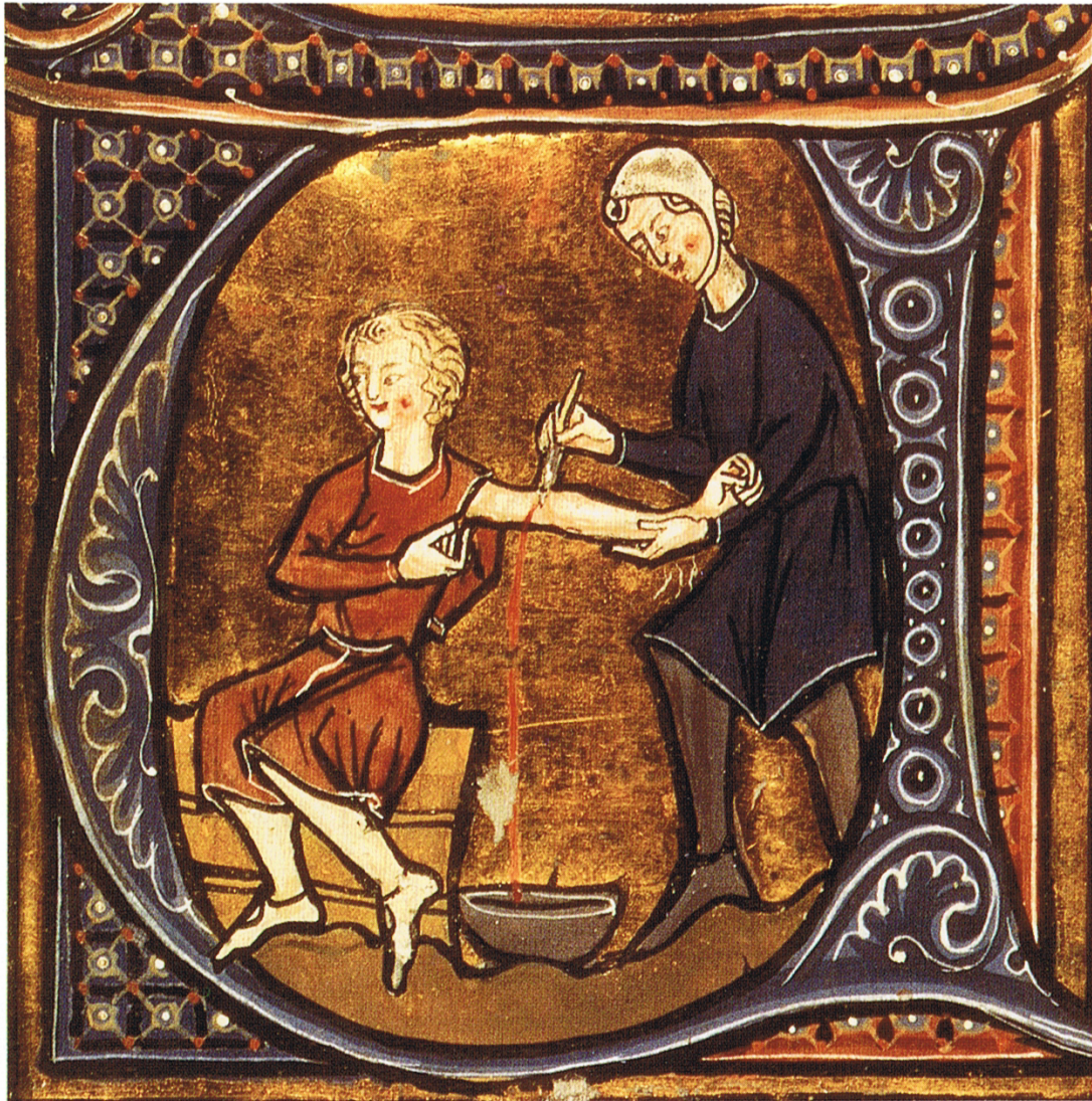
A világ legszélesebb körben alkalmazott terápia eljárása Az ókori Görögországból: