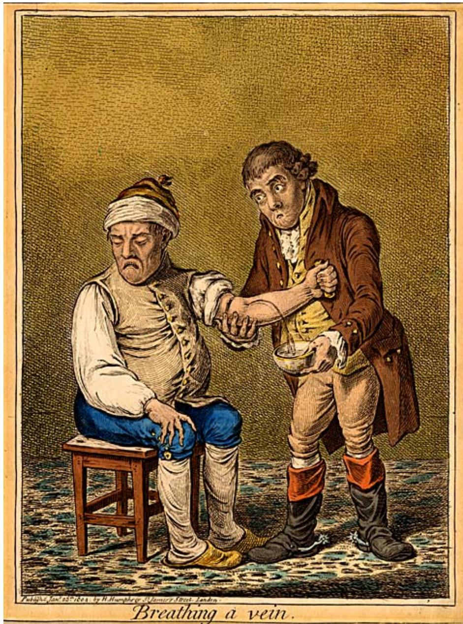
A világ legszélesebb körben alkalmazott terápiás eljárása A középkorból: