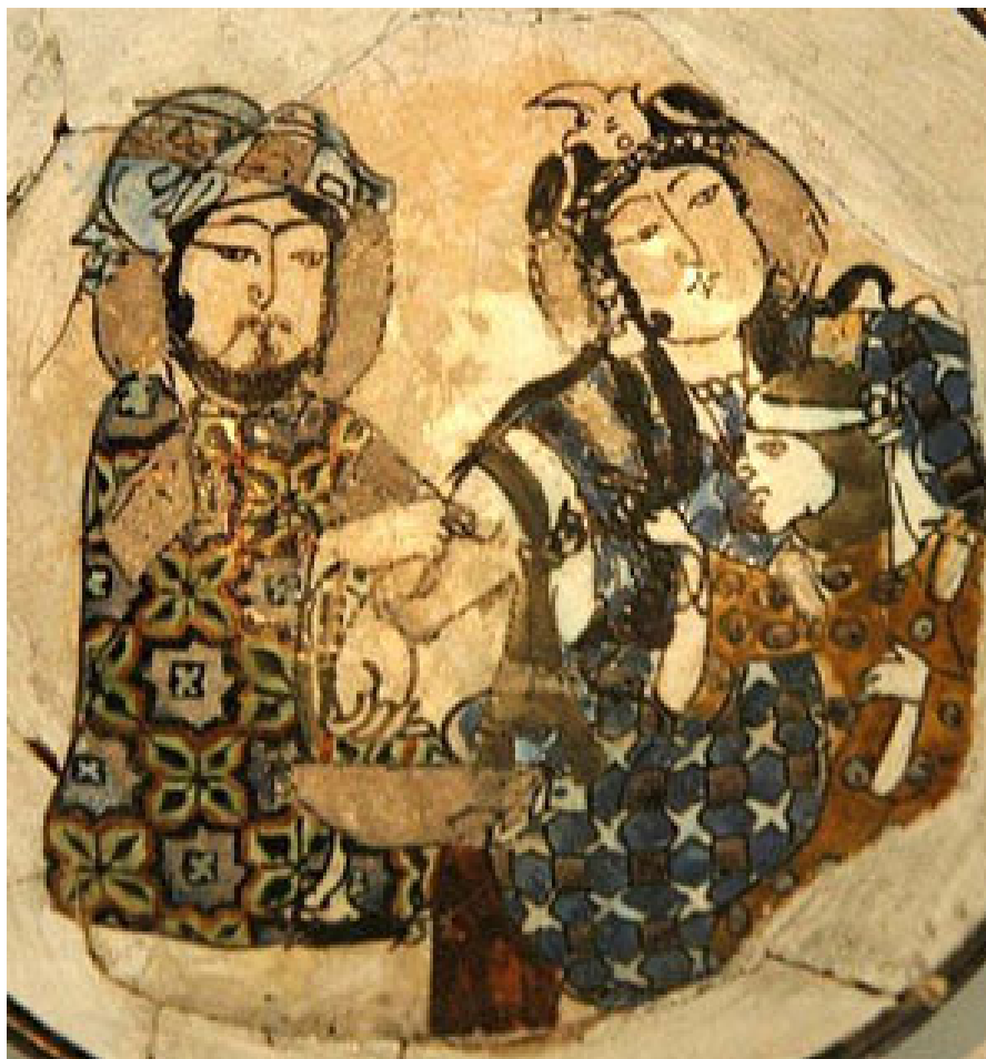
Az (igen késői) folytatás