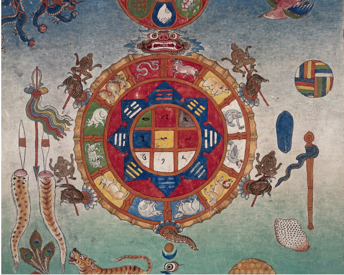
A világ legszélesebb körben alkalmazott terápia eljárása Közel-Keletről: