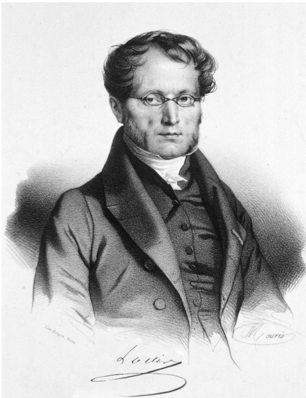
Pierre-Charles-Alexandre Louis (1787-1872)