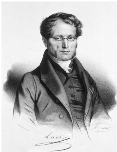
Pierre-Charles-Alexandre Louis (1787-1872)